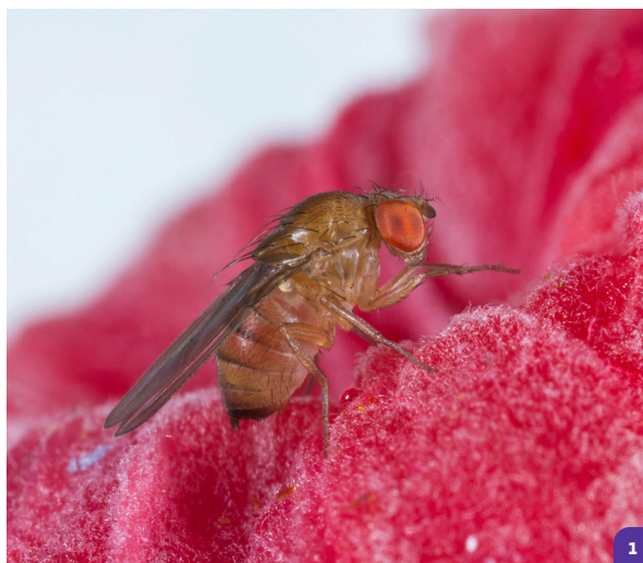
Adulte femelle de drosophile à ailes tachetées ( Drosophila suzukii ) sur une framboise.

Au Québec, c'est à l'automne 2010 que le premier et seul spécimen a été observé près d'un composteur domestique dans une zone résidentielle de la région de la Capitale-Nationale. Si, en