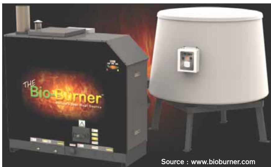
Figure 1. L'appareil de combustion du projet de recherche : le Bio-Burner.

En parallèle, un modèle de prédiction sera développé à partir des principes théoriques