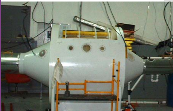
Différentes vues du banc d'essai