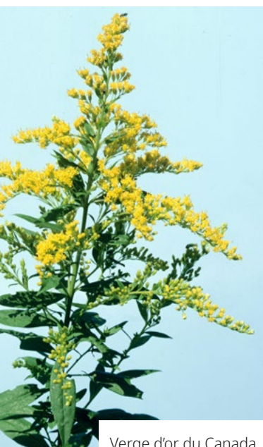
Verge d'or du Canada