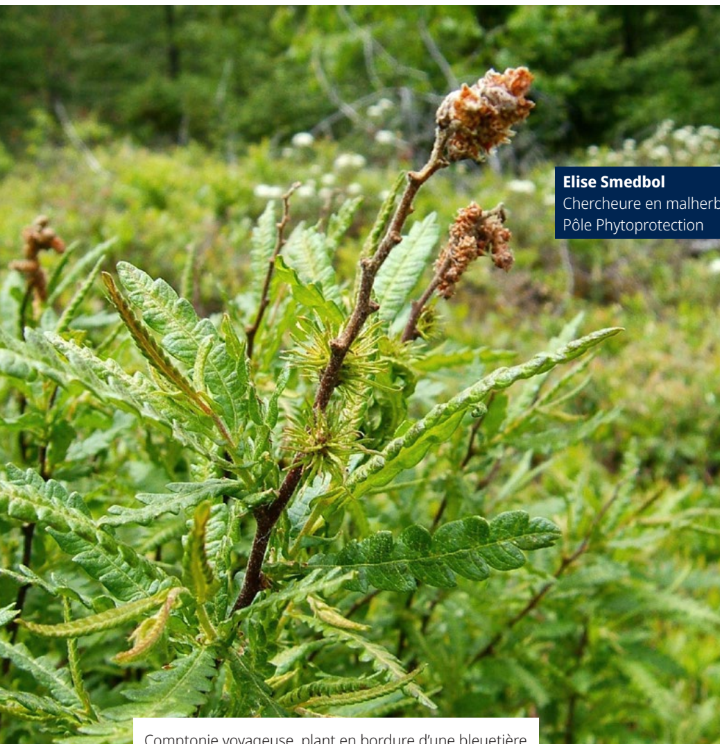
Comptonie voyageuse, plant en bordure d'une bleuetière