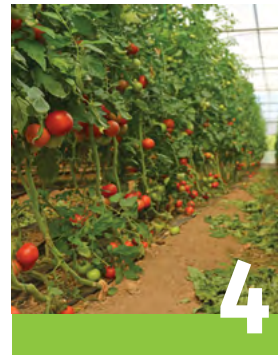
Cultures en serre et activités maraîchères hivernales