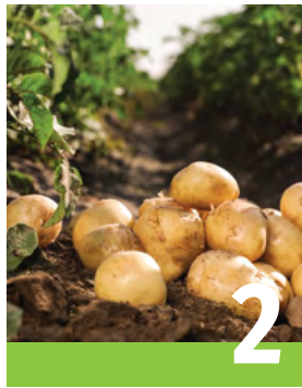
Pommes de terre