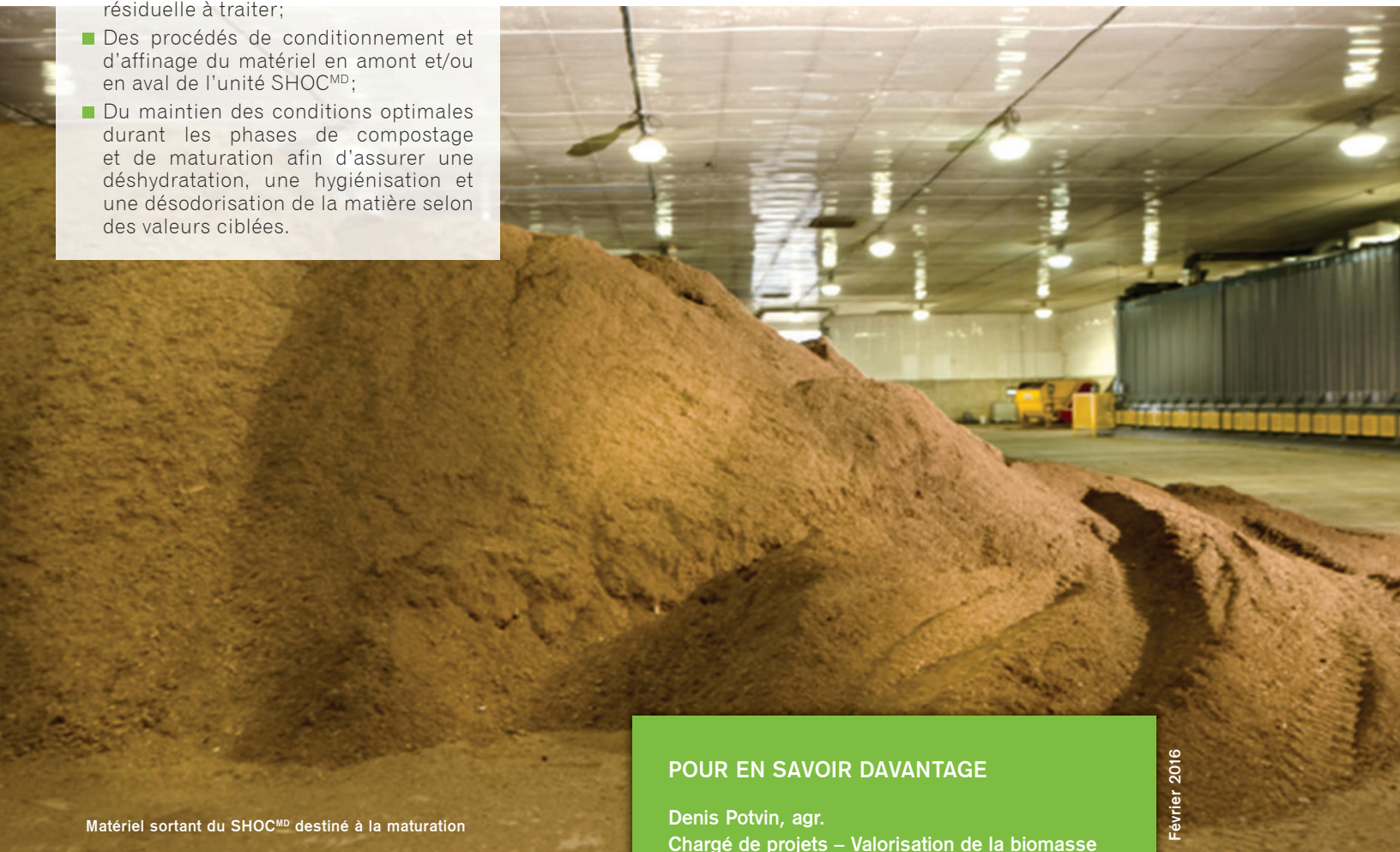
Matériel sortant du SHOC MD destiné à la maturation