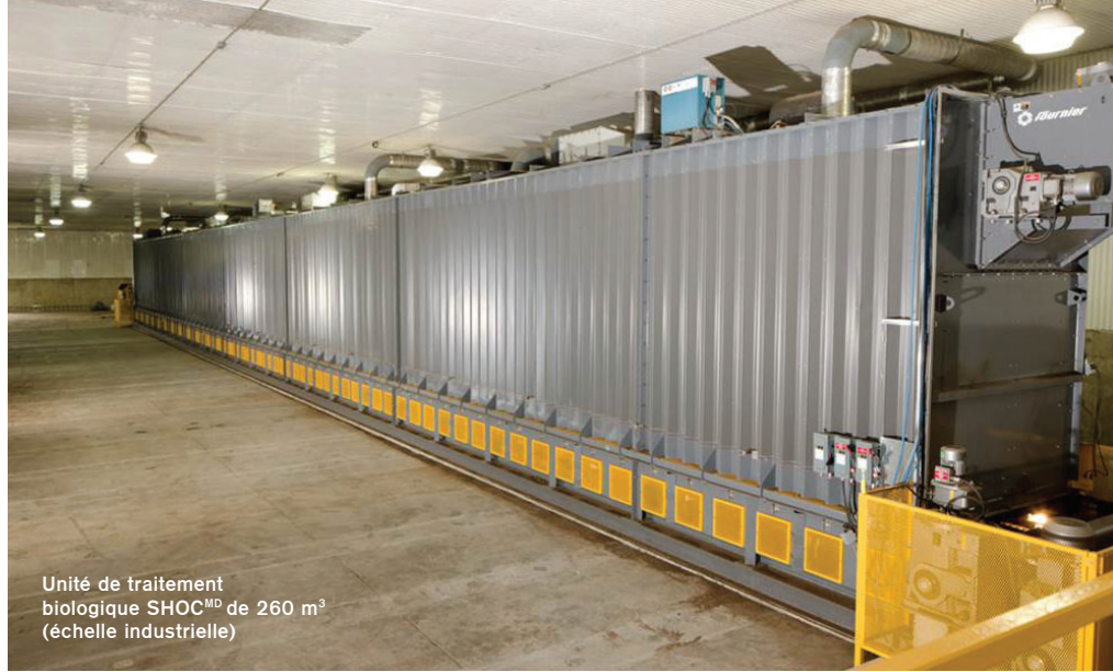
Unité de traitement biologique SHOC MD de 260 m 3 (échelle industrielle)

La chaleur dégagée par l'activité microbienne intense permet d'atteindre rapidement, dans l'enceinte fermée et isolée, des températures d'hygiénisation (> 55°C) lors de la phase thermophile. Un système d'aération forcée et contrôlé permet de composter et de biosécher l'ensemble de la matière. Ainsi, le procédé SHOC MD ne génère pas de lixiviat. L'air vicié pourra être capté et acheminé vers une unité de traitement, notamment par biofiltration pour traiter efficacement les gaz et les odeurs.