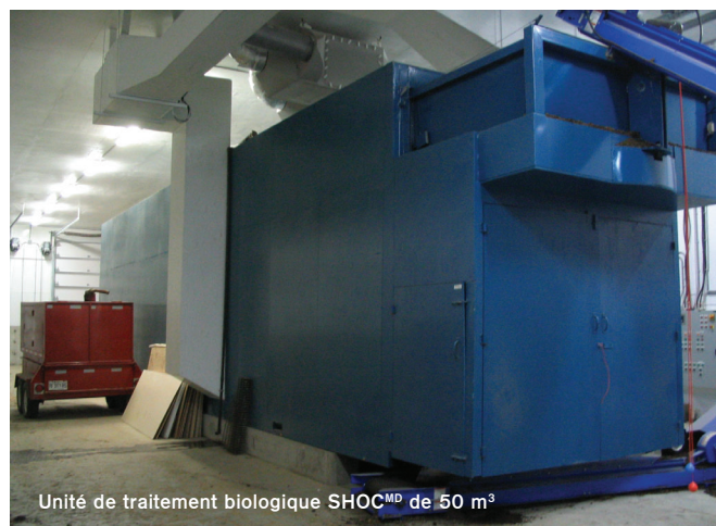
Unité de traitement biologique SHOC MD de 50 m 3

Une unité pilote a été développée et mise au point dans les laboratoires de l'IRDA et par la suite, une unité de 50 m 3 pour le traitement de la fraction solide de lisier dans d'une entreprise agricole porcine a été implanté en Montérégie et une seconde unité industrielle de 260 m 3 a été installée en Beauce pour le traitement de fumiers, de matières ligneuses et de biosolides.