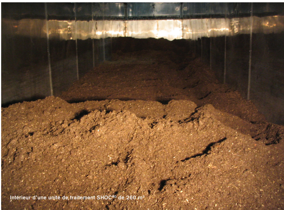
Intérieur d'une unité de traitement SHOC MD de 260 m 3